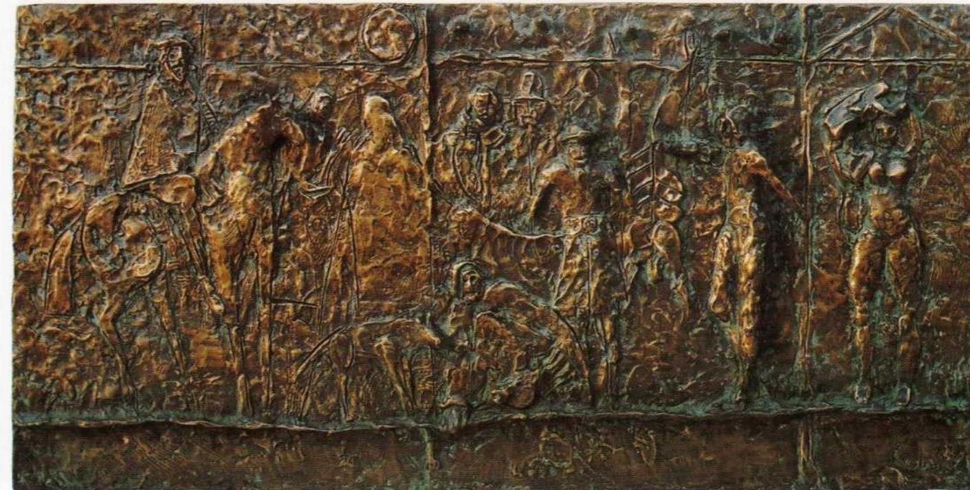
Gauchos - bronze

Na obra de Cédron a arte confere um sentido às coisas, e depois acrescenta sentido a esse sentido. Torna as coisas simultaneamente mais simples e mais complexas. Purifica-as e enriquece-as. Para significar, tem de escolher, purificar; ao significar, aprofunda, enriquece. Viva o Mestre. Viva a Vida. Álvaro Lobato de Faria - 2000