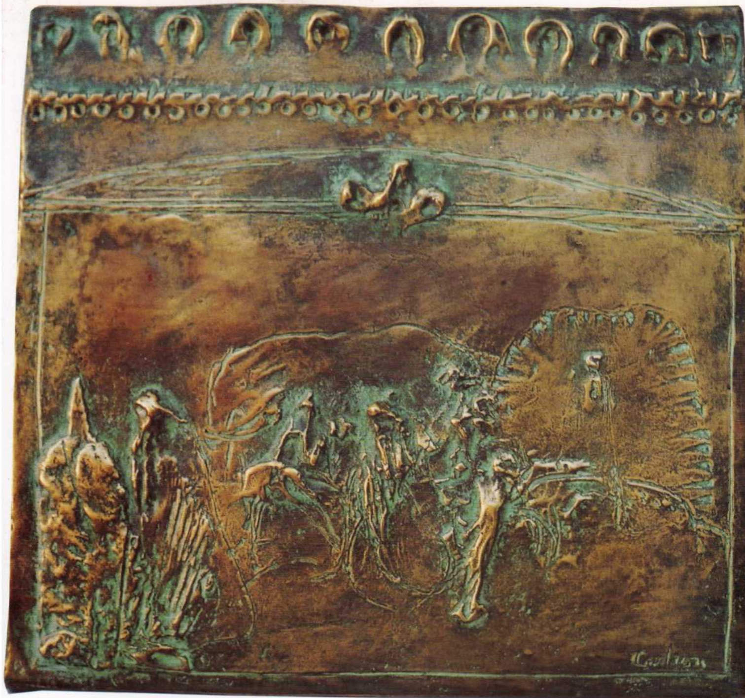
Espíritos - bronze