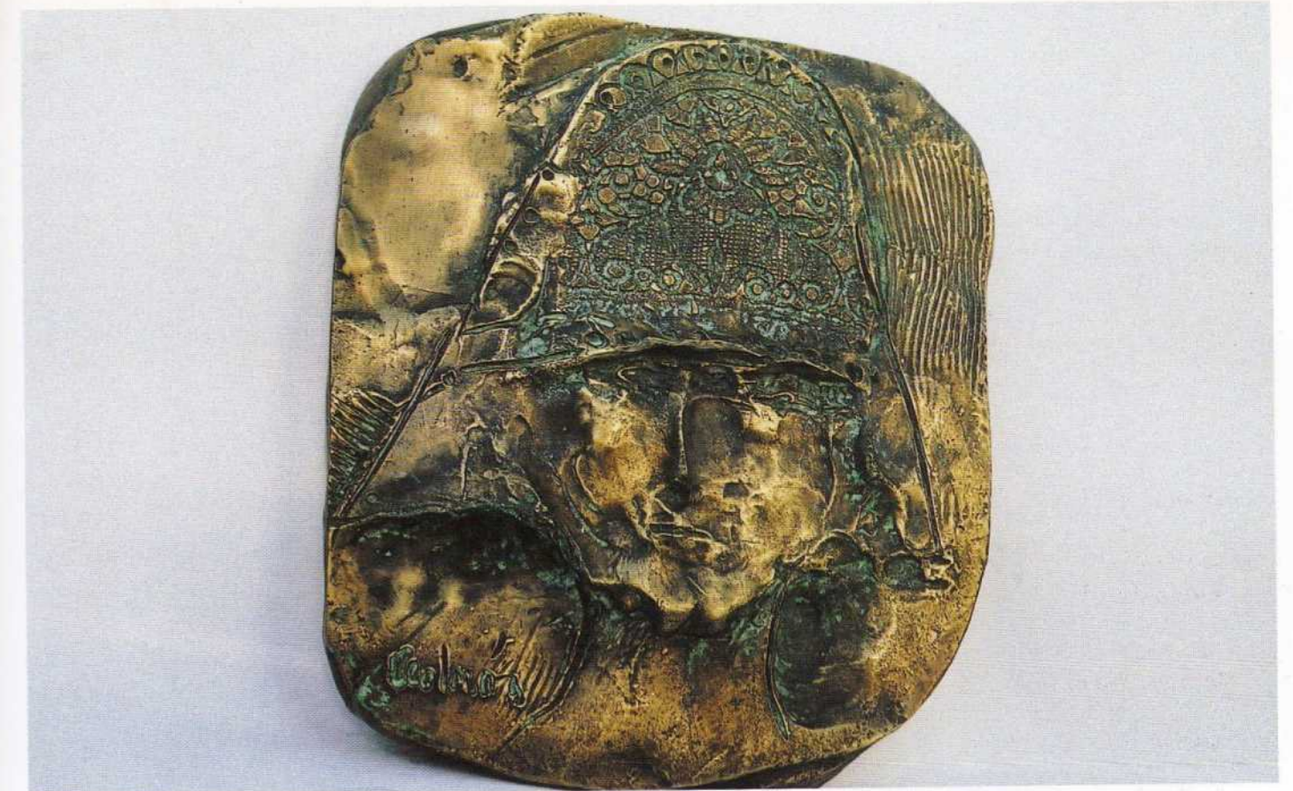
Guerreiro - bronze