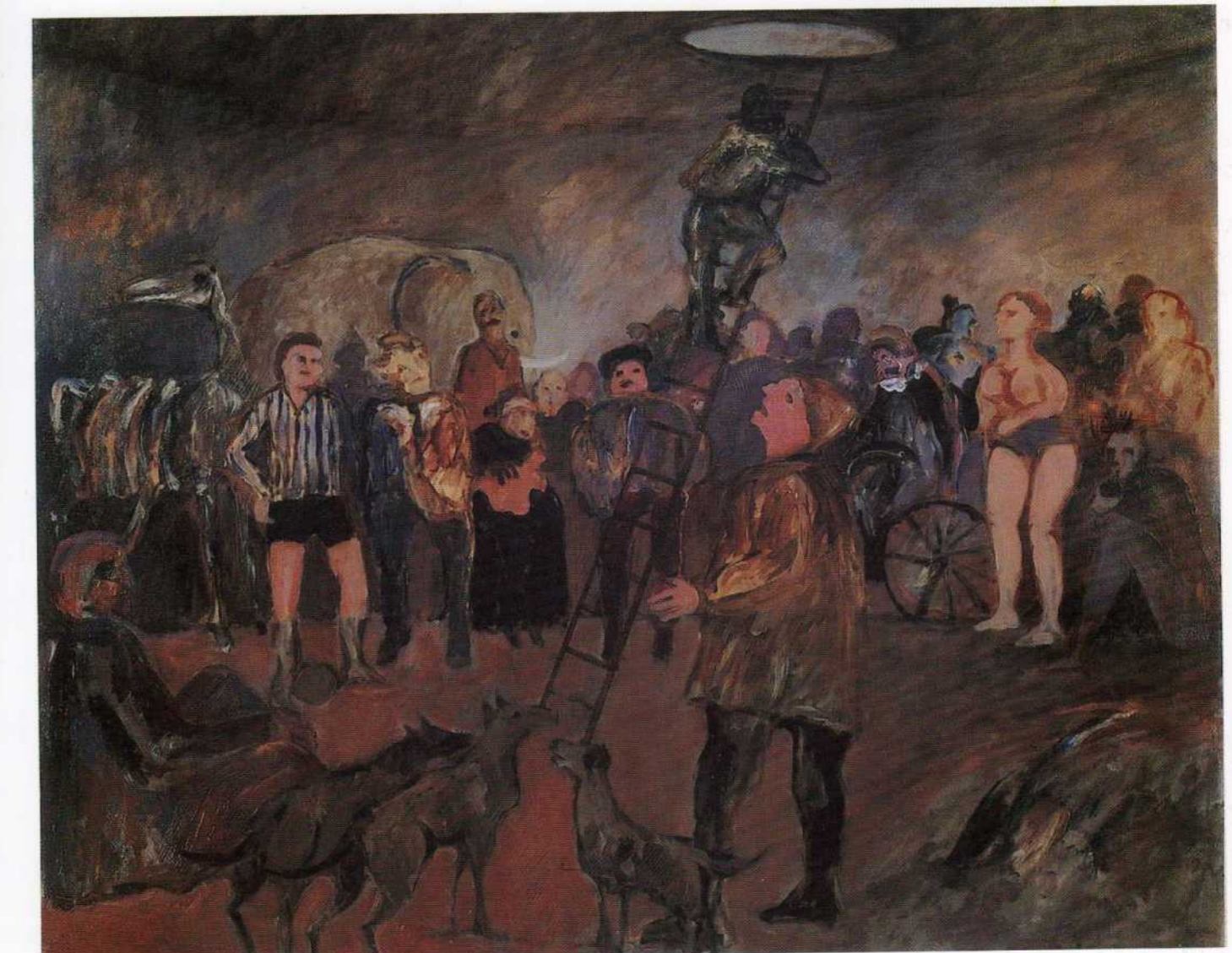
Underground - acrílico s/tela