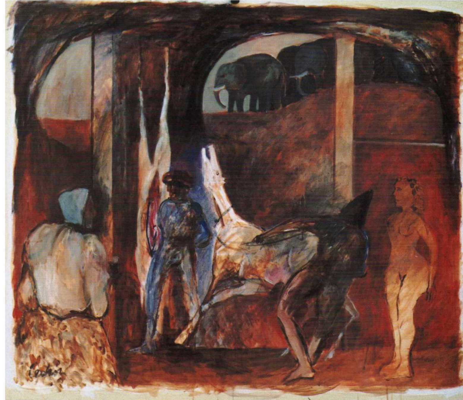
Caballos Blancos - acrílico s/tela